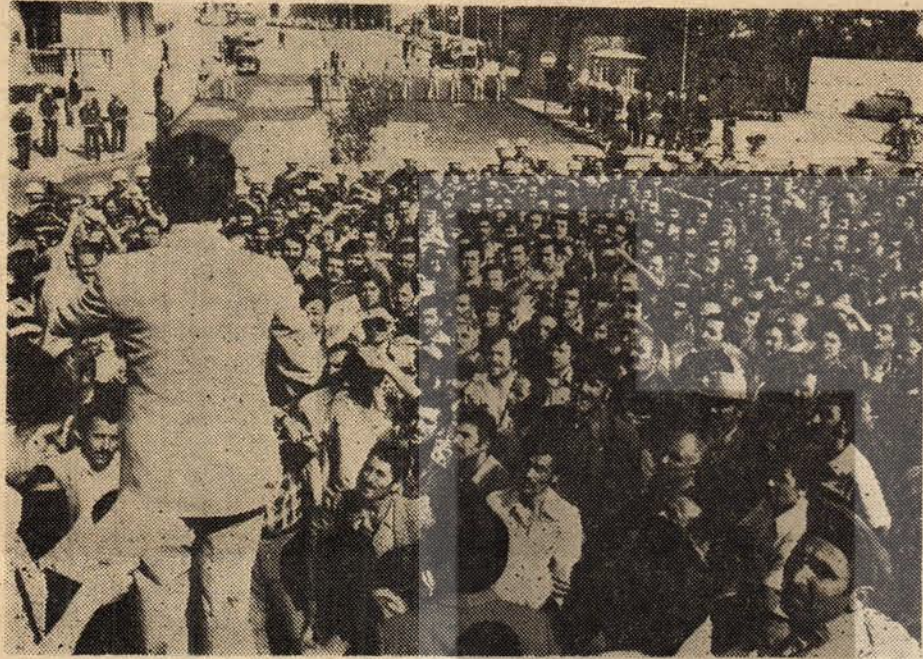
Şimdi : «Mücadelemiz sürecektir. Patronların nasıl teşkilâtı olduklarını bir kere daha gördük. Teşkilâtlanma gereğini bir kere daha kavradık.» diyorlar.

Kırıkkale işçisinin mücadelesi mutlaka zafer kazanacak.